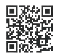
メイシアター インターネットチケット